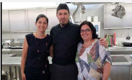
Das griechische Kochteam

Wann: Samstag, 21. Oktober 2017. Zeit: 14 bis 16 Uhr. Ort: Ufficina, Via Nouva 1, 7503 Samedan. Anmeldung: bis 17. Oktober 2017: Infos: Regionalstelle Südbünden.