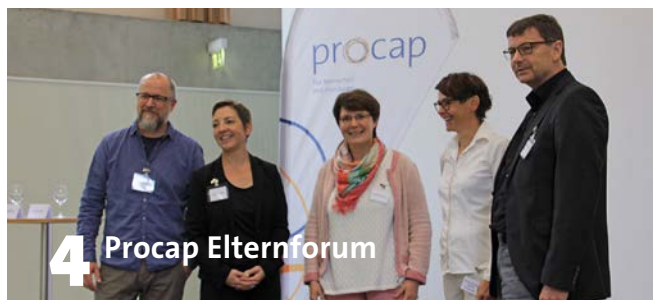
4 Procap Elternforum