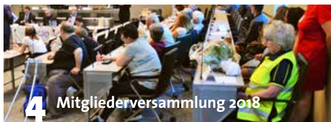
4 Mitgliederversammlung 2018