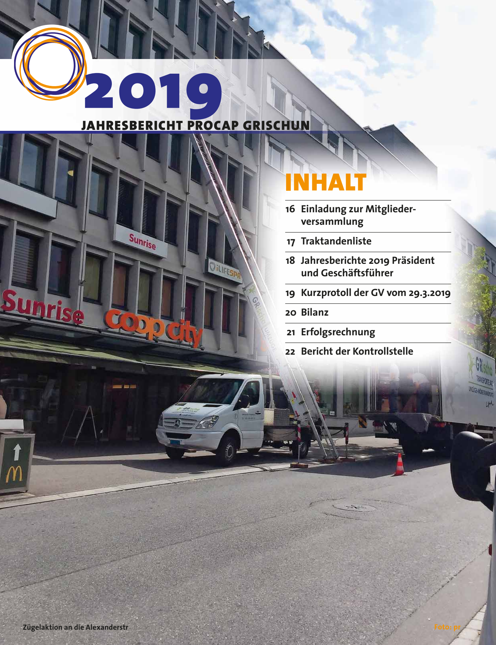
Zügelaktion an die Alexanderstr