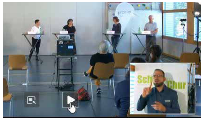
Das Inputreferat und die Podiumsdiskussion mit Live-Übersetzung in Gebärdensprache.

Es besteht die Möglichkeit, das Forum vor Ort in Rothenbrunnen (Giuvaulta) zu besuchen und sich mit anderen Betroffenen zu vernetzen oder als Live Stream auf www.procapgrischun.ch . Für Teilnehmer mit einer Hörbeeinträchtigung ist es möglich, das ganze Forum mittels Gebärdenübersetzung zu verfolgen. Das Forum wird aufgezeichnet und kann später verfolgt werden.