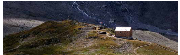
SAC Kesch Hütte

Procap Grischun organisiert eine Tour zur Kesch Hütte für Rollstuhlfahrer. Mitglieder des SAC-Prättigau, SAC Rätia und des SAC-Davos verstärken uns auf dieser Tour. Gemeinsam mit den vielen freiwilligen Helfern starten wir am 28. August ab Bergün und fahren mit Mini-Bussen bis «Tuors Chants». Dort beginnt die Wanderung zur Hütte. Unterwegs machen wir Halt und verpflegen uns aus dem Rucksack. Nach dem Aufstieg zur Hütte erwartet uns ein feines Nachtessen und entschädigt uns für die sportliche Leistung. Mit der Übernachtung in der Kesch Hütte schliessen wir den ersten Tag ab. Nach dem Morgenessen nehmen wir den Abstieg durch das wildromantische Val Susauna nach Chapella im Engadin in Angriff. Mit den Mini-Bussen fahren wir zurück über den Albulana nach Bergün. Der Abschluss erfolgt wieder am Ausgangspunkt beim Bahnhof Bergün. Nach dieser Tour, ob für Teilnehmer oder Begleiter, gibt es mit Sicherheit etwas zu erzählen von den vielen Eindrücken dieser abenteuerlichen Exkursion. Wir bedanken uns schon jetzt recht herzlich bei den vielen Helfern, die diese Tour möglich machen.