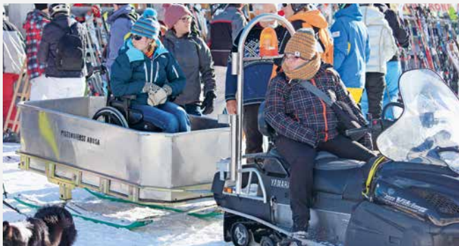
Mit dem Motor-Schlitten zum Zelt.

Neue Ideen und gefeierte Kult-Sketches – welche schöne Bescherung! Das völlig ausgelieferte Publikum wird mit einem Balsam aus herrlichen Kostümen, gnadenloser Improvisationsfreude und wunderbarem Weihnachtswitz beschenkt.