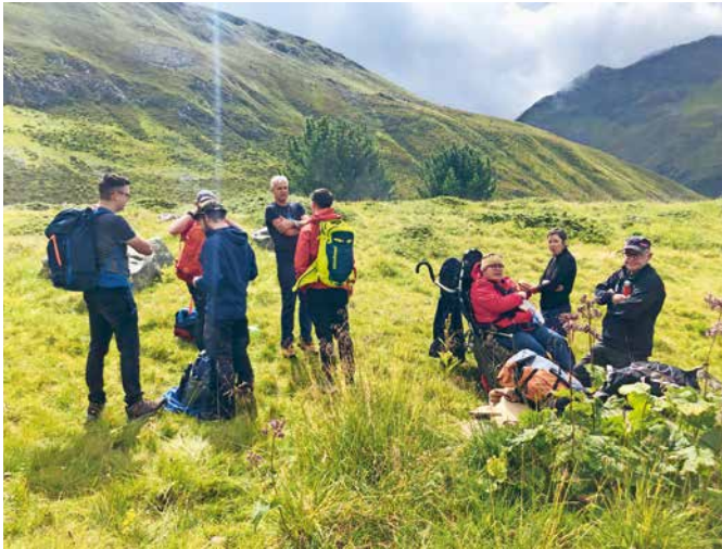
Mittagspause beim Aufstieg.