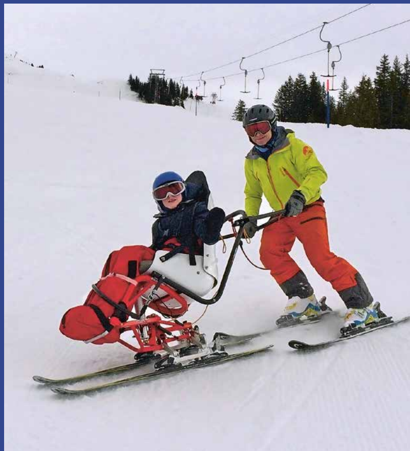
Dualskibob mit Führungsbügel.

Der Schnuppertag findet am Sonntag, 27. März 2022 auf der Lenzerheide beim Skilift Fadail statt. Die Teilnehmenden rüsten sich mit Skihelm, Skibrille, warmen