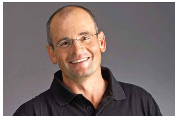
Markus Proske.

Anmeldung: www.procapgrischun.ch oder 081 253 07 07