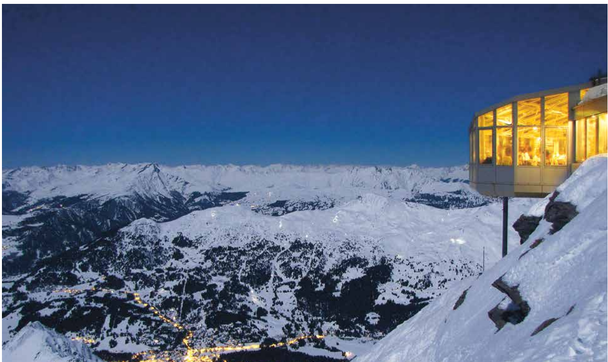
Restaurant Rothorn.

Die An- und Heimreise an die Mitgliederversammlung erfolgt mit reservierten Postautos ab dem Postautodeck in Chur. Die Mitglieder können selbstverständlich auch individuell auf die Lenzerheide reisen.