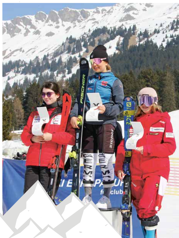
Rechts: 3. Rang im Kombinations-Slalom.

blickend. Heute turmt sie kaum noch. In ihrer Freizeit spielt sie lieber mit ihren Kolleginnen Fussball. «Aber nicht in einem Club, nur zum Plausch», betont sie.