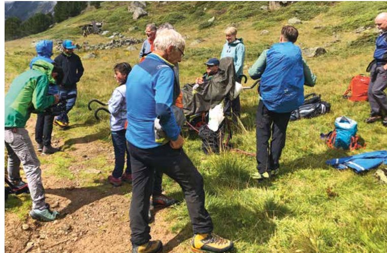
«Protrek» Tour zur Kesch Hütte.

Procap Grischun organisiert eine Tour zur Carschina SAC Hütte für Rollstuhlfahrer*innen. Damit diese sicher und gesund in der Carschina Hütte ankommen, braucht es genügend Begleiter*innen, welche diese Tour möglich machen. Mitglieder des SAC-Prättigau und SAC-Davos verstärken uns auf dieser Tour. Für die Unterstützung wird kein Lohn ausbezahlt, jedoch werden die Übernachtungskosten auf der Carschina SAC Hütte übernommen. Wir suchen Begleiter*innen, welche uns auf dieser Tour tatkräftig unterstützen.