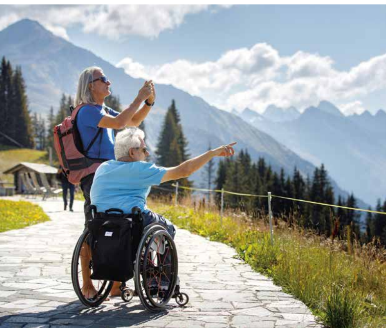
Davos Klosters Access Unlimited engagiert sich für ein attraktives, durchgehend barrierefreies Angebot.

Angebote, welche heute schon zur Verfügung stehen: Eisgleiter Sportzentrum Davos, Rollstuhltennis in der Tennis-halle Klosters, JST-Rollstuhl (geländegängiger Rollstuhl) auf Madrisa, Dual-Skibob auf Parsenn, Pedalo auf dem Davosersee und E-Tandem Bike in Davos.