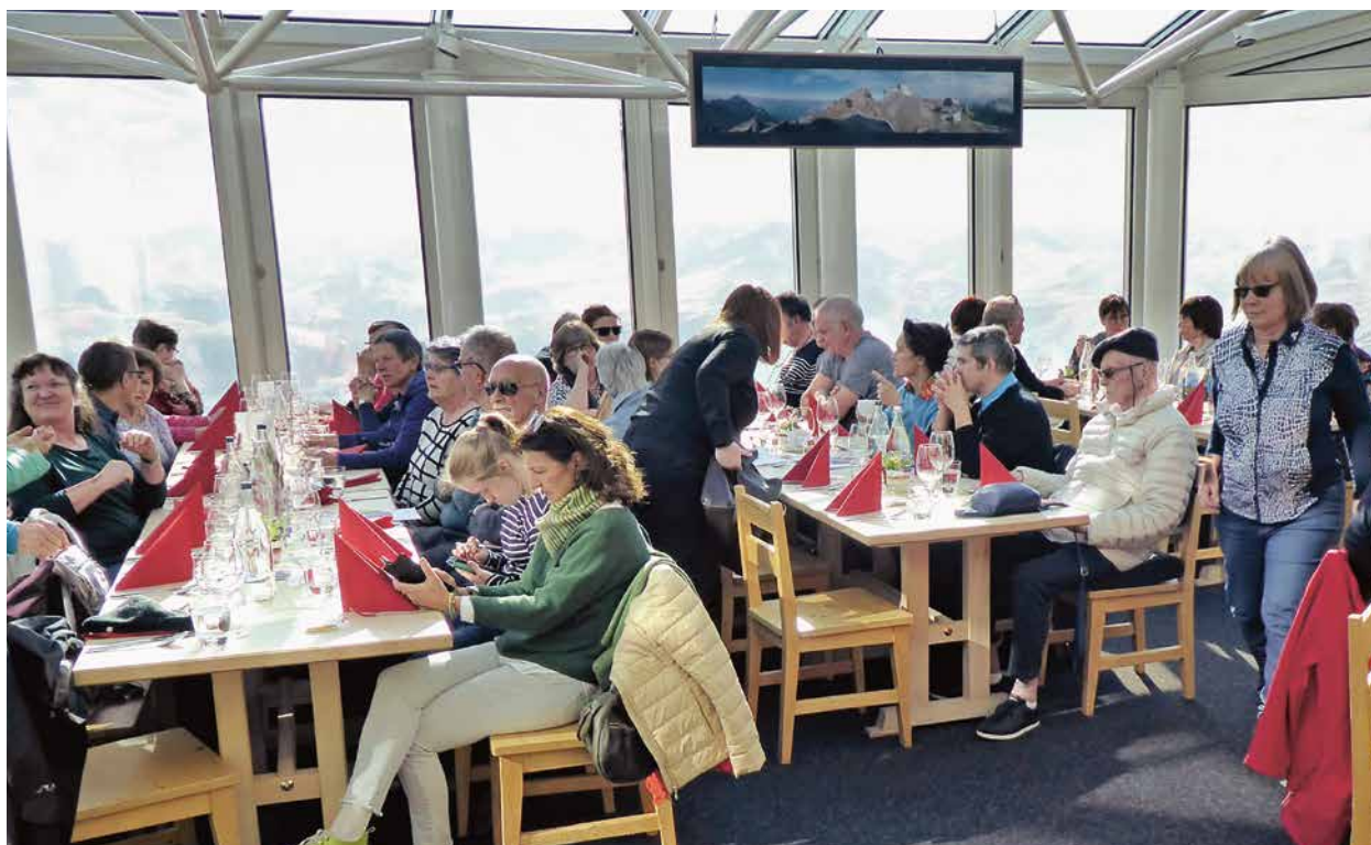
Panoramarestaurant Rothorn.

treffen zu können. So war der Ort der Versammlung bereits Programm – die vielen Berggipfel, die einmalige Aussicht, die tolle Stimmung und die vielen begeisterten Gesichter haben die Veranstaltung zu einem bleibenden Erlebnis gemacht.