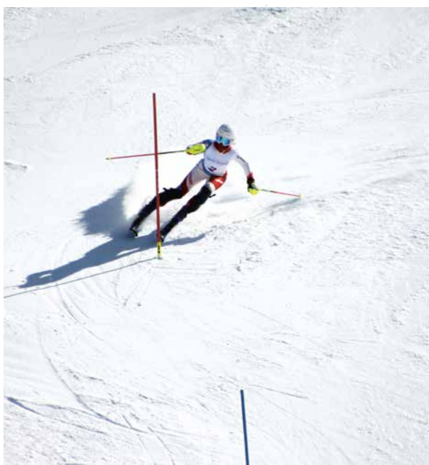
Oben: Slalom am Heimberg.