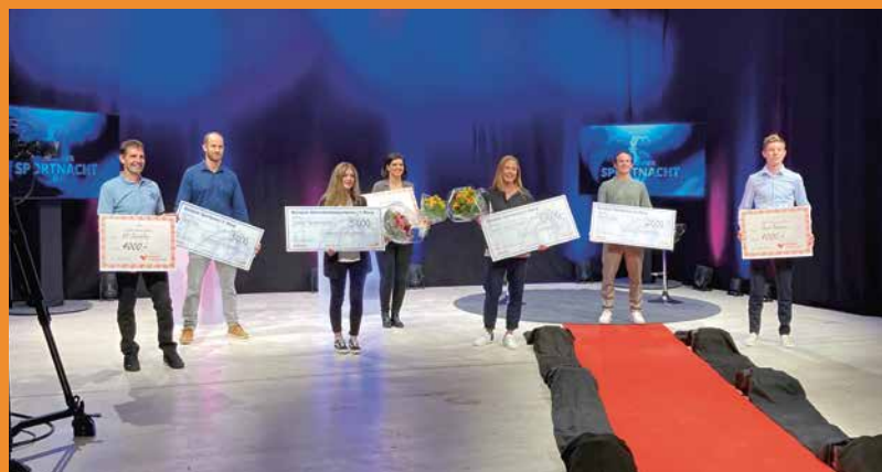
Sportnacht 2021.

Kennen Sie eine Persönlichkeit, welche im Behindertensport beachtenswerte Leistungen erbracht hat? Lassen Sie es uns wissen. Wir freuen uns, die Sportler*innen einem breiten Publikum vorzustellen.