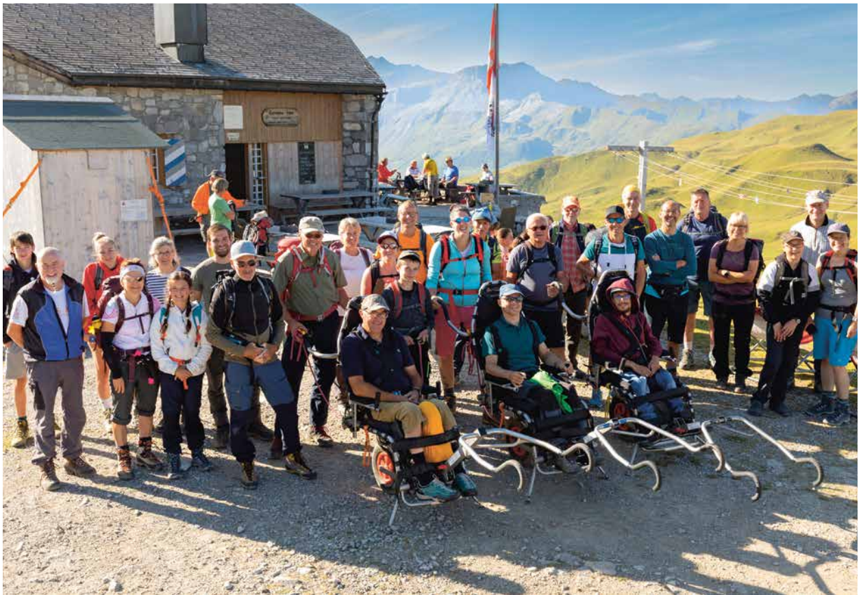
Gruppenbild Carschinahütte.

den Weg durch das Steinfeld, wo wir während einer längeren Pause sogar einige Seilschaften am Klettersteig beobachten konnten. Nach dem eindrucksvollen Abstieg genossen wir die verdiente Mittagspause am Partnunsee. Unfallfrei und mit einer gesunden Müdigkeit erreichten wir gegen Abend wieder St. Antönien. Ohne die vielen Helfenden wäre eine solche Tour nicht möglich. Den vielen hochmotivierten Helfer*innen gebührt ein großes Dankeschön. Wir freuen uns heute schon auf die nächste Tour.