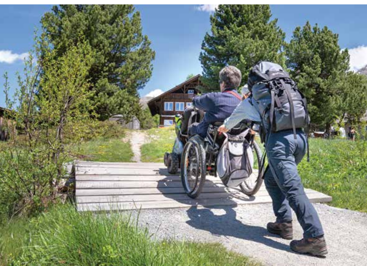
Weg zum Lej da Staz.

Ja, das ist so. Ein Fussgänger kann sich oft nur schwer in die Welt der Rollstuhlfahrerin hineinversetzen und umgekehrt versteht jemand im Rollstuhl nicht, weshalb es für