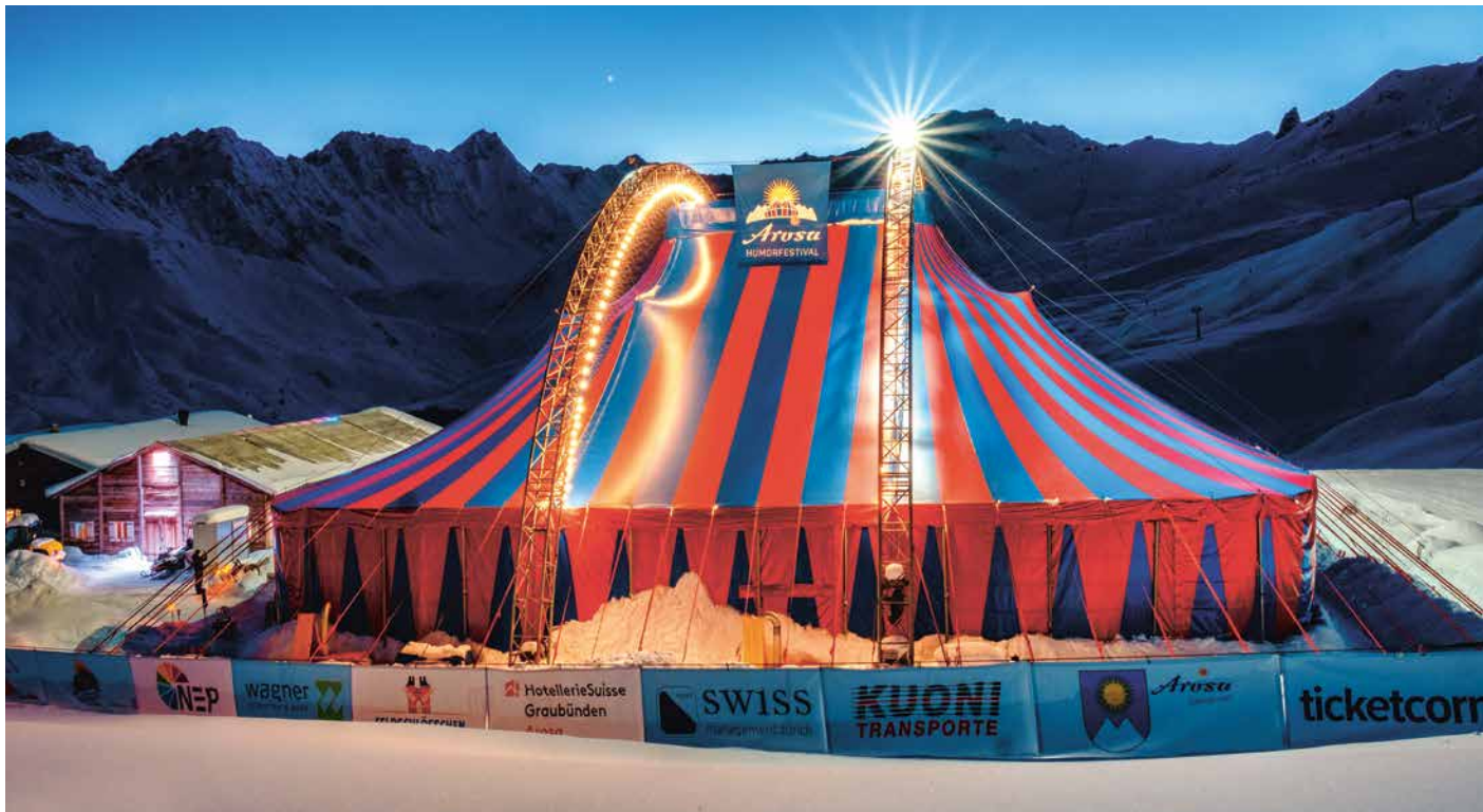
Humorfestival Arosa.

Eintrittskarte inbegriffen. Das Inkasso der Unkostenbeiträge erfolgt direkt im Zug; Anmeldung/Infos: Geschäftsstelle in Chur oder www.procapgrischun.ch ; Anmeldeschluss: Mittwoch, 7. Dezember 2022. Die Anzahl der Teilnehmer*innen ist beschränkt.