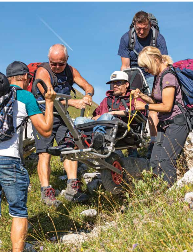
Abstieg zum Partnunsee.

Nach der letztjährigen Protrek-Tour zur Kesch-Hütte bei Schnee, Wind und Regen waren die Wetterverhältnisse geradezu ideal für eine Wiederholungstour.