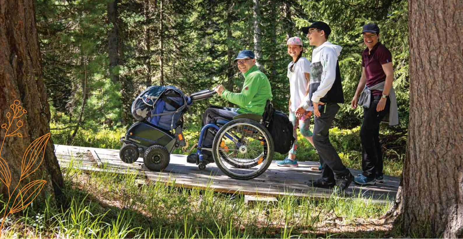
Weg zum Lej da Staz.

die gehende Person nicht offensichtlich ist, dass er oder sie nur einen kleinen Schub bräuchte.