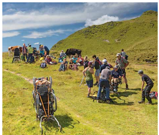
Besuch der neugierigen Kühe während unserer Mittagspause.

den Weg durch das Steinfeld, wo wir während einer längeren Pause sogar einige Seilschaften am Klettersteig beobachten konnten. Nach dem eindrucksvollen Abstieg genossen wir die verdiente Mittagspause am Partnunsee. Unfallfrei und mit einer gesunden Müdigkeit erreichten wir gegen Abend wieder St. Antönien. Ohne die vielen Helfenden wäre eine solche Tour nicht möglich. Den vielen hochmotivierten Helfer*innen gebührt ein großes Dankeschön. Wir freuen uns heute schon auf die nächste Tour.