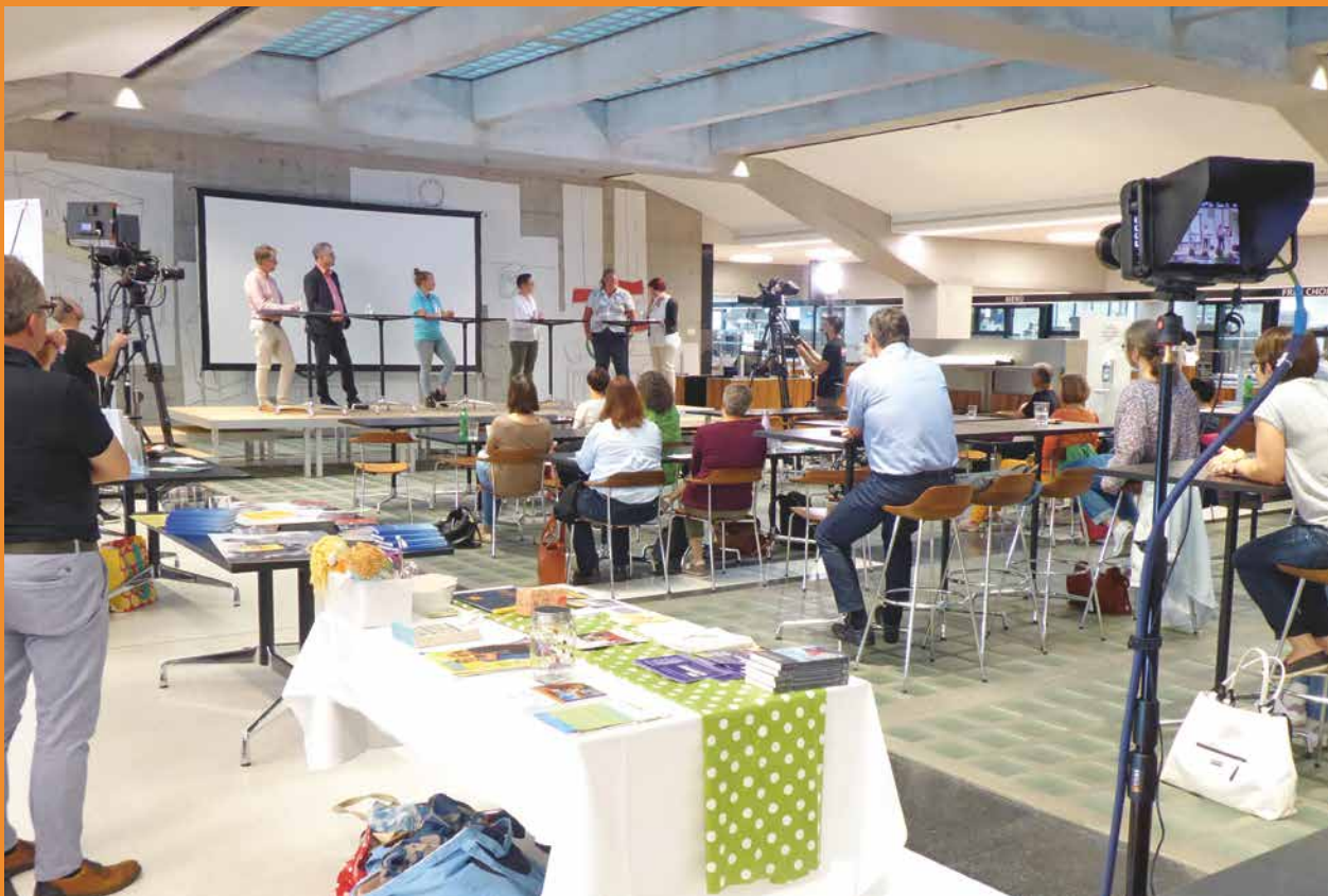
Forum mit Livestream.

wer was zahlt und wie es organisiert wird. Dabei ging Martin Boltshauser auf die neuen Regelungen der HE (Hilflosenentschädigung) und des IPZ (Intensivpflegezuschlag) ein, welche als wichtige Unterstützung in Anspruch genommen werden können. Die neue Betreuungsentschädigung erzielt jedoch für die Eltern noch nicht den gewünschten Erfolg.