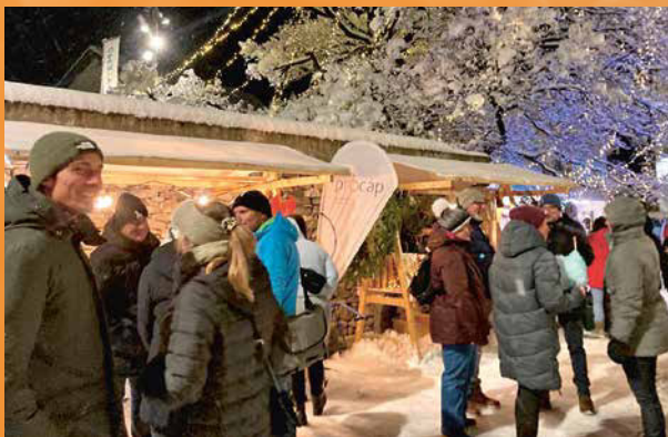
Am Weihnachtsmarkt in Domat/Ems.