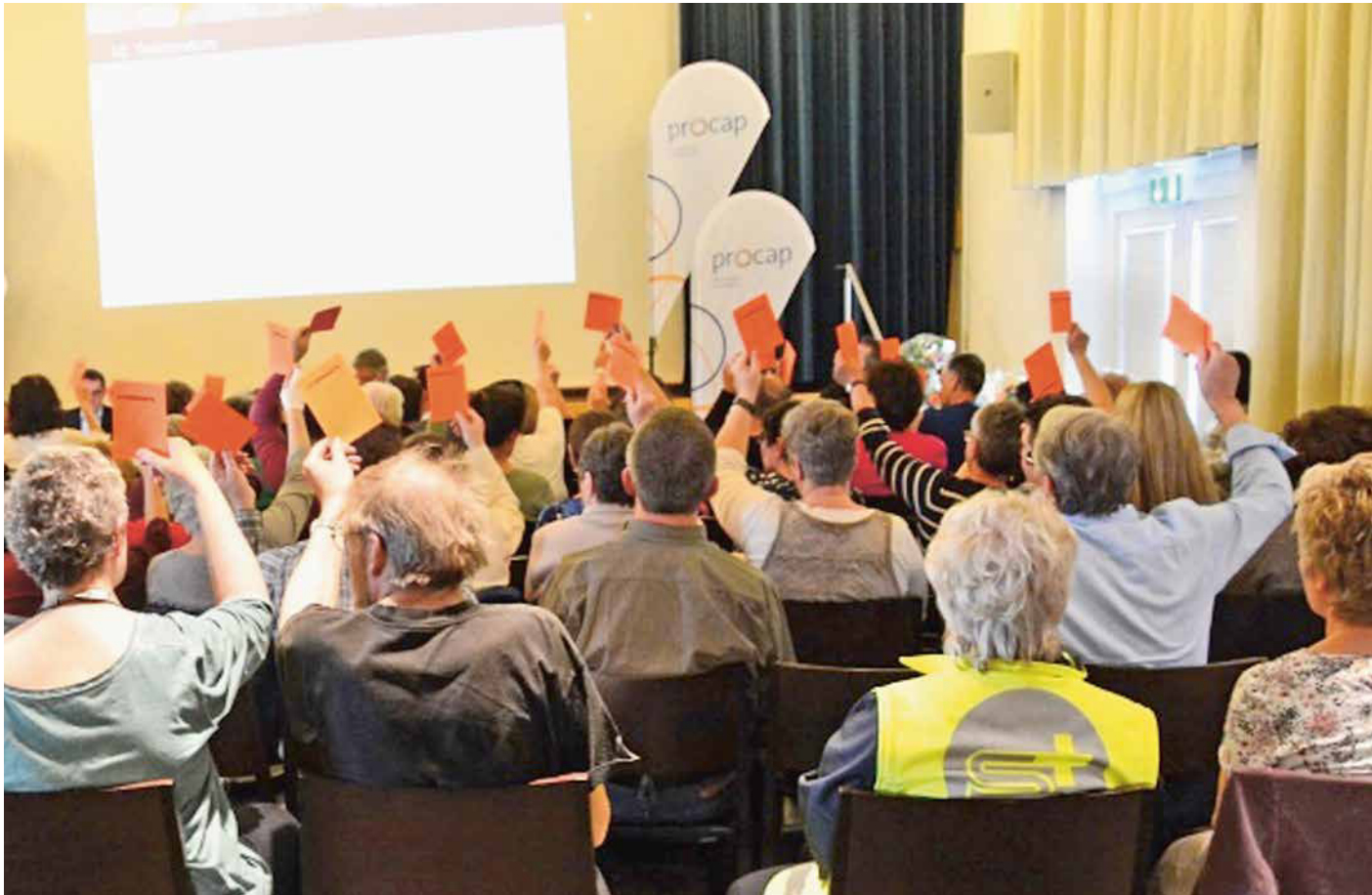
Abstimmung bei der Mitgliederversammlung.