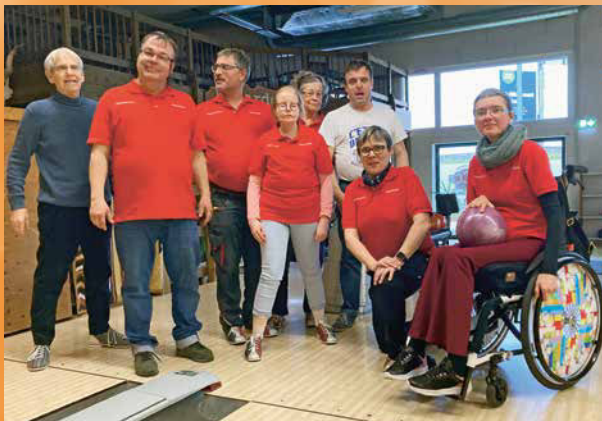
Das Bowling-Team mit dem gesponsorten T-Shirt von Raiffeisen Surselva.