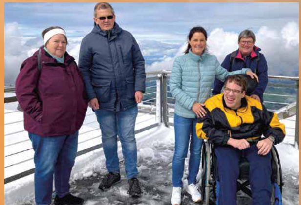
Herbstausflug auf den Säntis mit dem ersten Schnee im 2023.