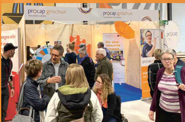
Procap an der Gewerbeausstellung in Scuol.