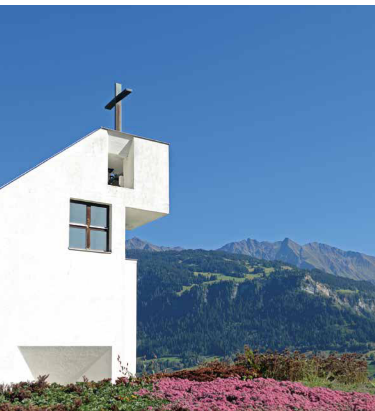
Haus der Begegnung Ilanz.

Der Vorstand von Procap Grischun freut sich auf Ihren Besuch.