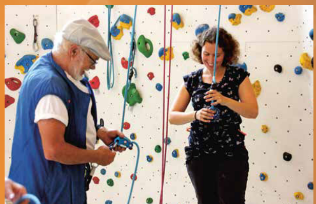
Kletterkurs in der Kletterhalle.