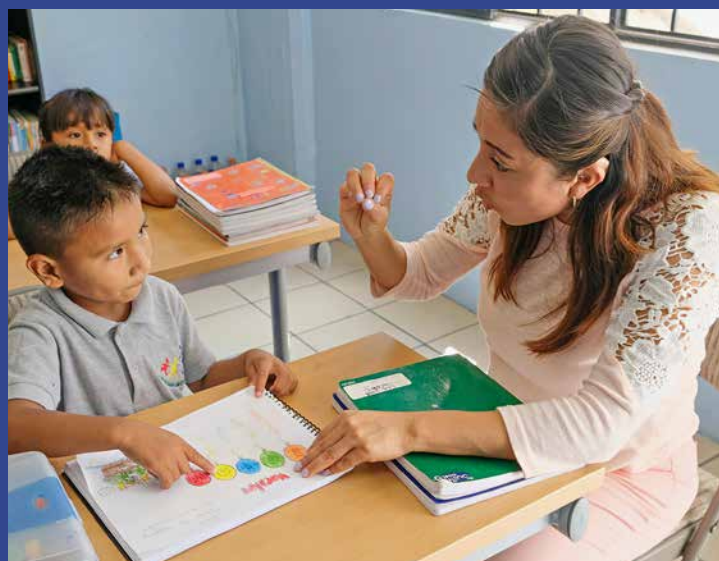
Integratives Lernen im Schulalltag.