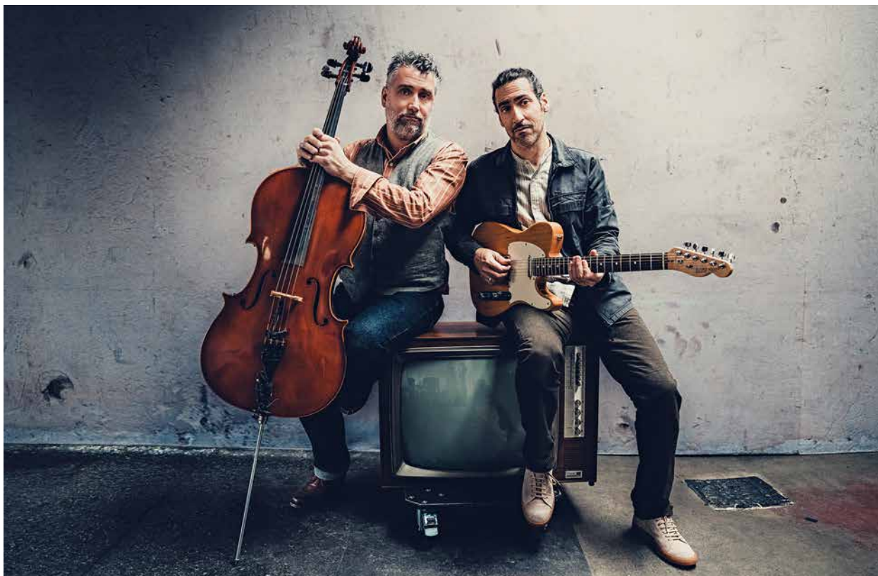
Riklin und Schaub: Lieder die du sehen musst.

warum es ihrer Meinung nach Waffen für den Frieden braucht. Ein Abend für Menschen mit Lust auf Tiefgang – aber nur knöcheltief.