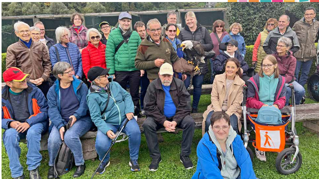
Ein unvergesslicher Moment mit dem König der Lüfte.

Am 27. September fand unser traditioneller Herbstausflug statt. Wir begaben uns auf eine inspirierende Tagesreise, die uns gleich zwei beeindruckende Welten eröffnete; die stille Pracht der Stiftsbibliothek St. Gallen und die lebendige Dynamik des Greifvogelparks Buchs. Der erste Teil unseres Ausflugs führte uns in die ehrwürdige Stiftsbibliothek St. Gallen – eine der ältesten Bibliotheken Europas und ein Ort, der Wissen, Geschichte und Spiritualität auf einzigartige