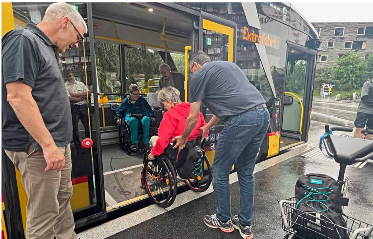
Einstieg ins Postauto bei der Haltestelle Murschetg mit erhöhtem Trottoir.

Gemeinde schätzen, wie zum Beispiel den Bahnhof, die Verfügbarkeit von Rampen, Führungslinien, Lifte, Hilfe in Gebärdensprache, Kontrastanzeigen, öffentliche Toiletten, Parkplätze, Türöffner, Haltestellen und vieles mehr.